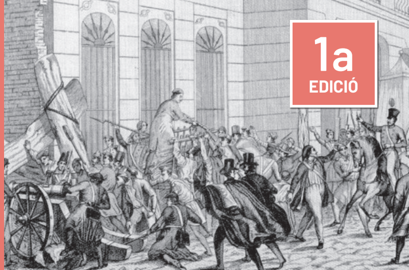
Rebombaris del pa a Barcelona, 28 de febrer de 1789.