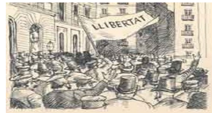
Il·lustració de Josep Narro ( Pels camins d'Utopia , 1958)

"El redescobriment del Paral·lel ha vingut acompanyat com no podia ser altrament d'una mitificació que potencia uns aspectes del lloc i n'oblida uns altres. No hi ha hagut un sol Paral·lel, n'hi hagut molts i diversos, els llocs canvien i es transformen dia a dia, no podem parlar d'una sola realitat, cada teatre, cada cafè, cada racó, cada personatge, té la seva pròpia història."